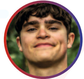
Mate Rings 19 J. - MT, SO, PF